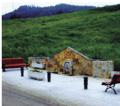
Así la dejó La USPC