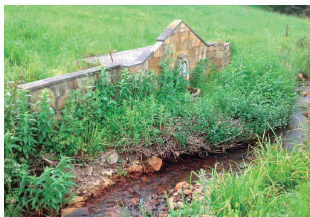
Así la dejó el odio del PSOE - IU